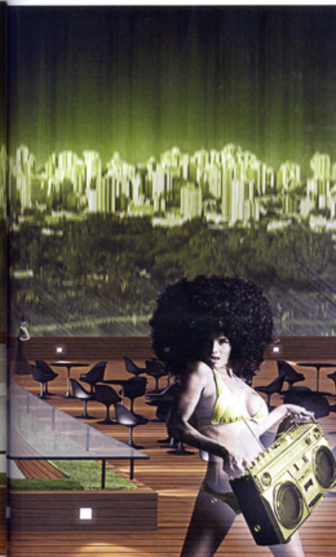
À esquerda, no terraço, clarabóia de vidro e deque de madeira de demolição. Abaixo, vista externa com jardins verticais, tijolos nas paredes e muita madeira